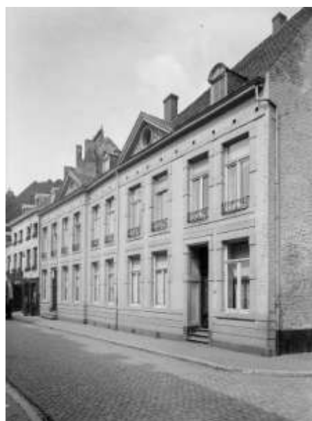
Links: Kleine Gracht 22 en 20