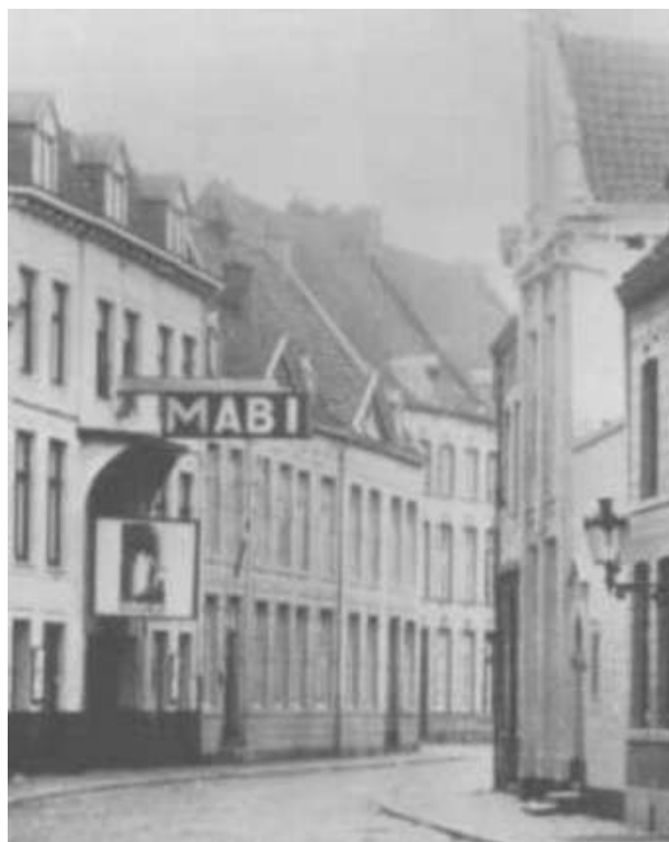
Kleine Gracht ca. 1930.

In 1787 heeft Hollard geluk en wint in de Staatsloterij een prijs van f 30.000,-. Hij is nu plotseling een vermogend man. De eigenaar van het pand is bereid niet alleen het grote huis maar ook de twee ernaast gelegen huisjes te verkopen voor de prijs van 15.750,- Luikse guldens. De twee kleine panden worden nu afgebroken en op de open gevallen plek wordt een huis gebouwd dat uiterlijk