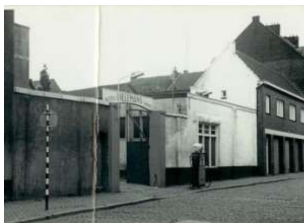
Coxstraat: uitgang van de garage met benzinepomp. Geheel rechts nieuwbouw vier garageboxen en bovenwoning in de plaats gekomen voor de paardenstal en hooizolder.