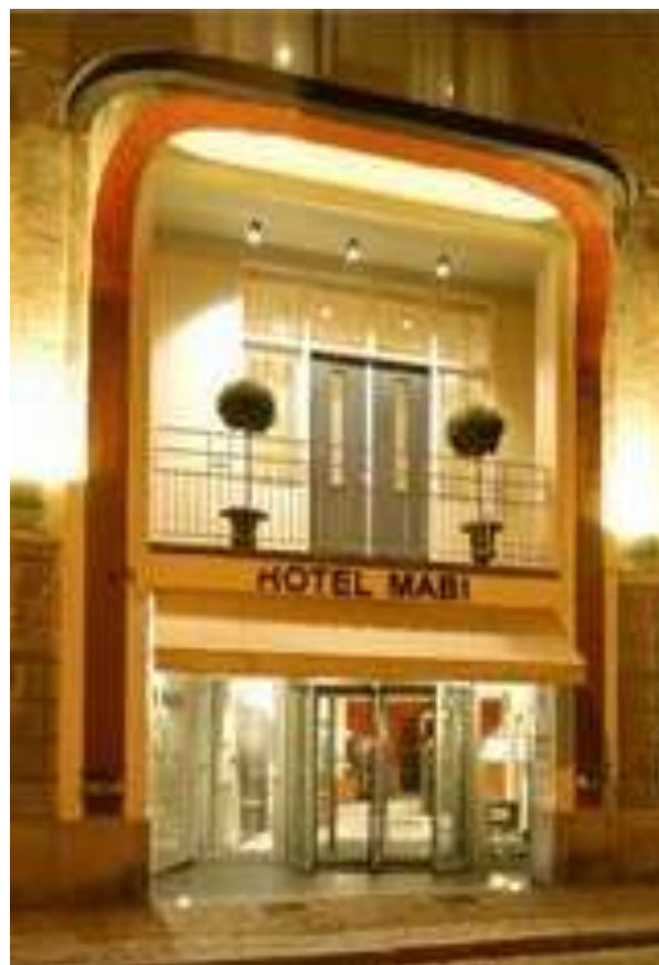
City Centre Hotel Mabi geopend in 1997.