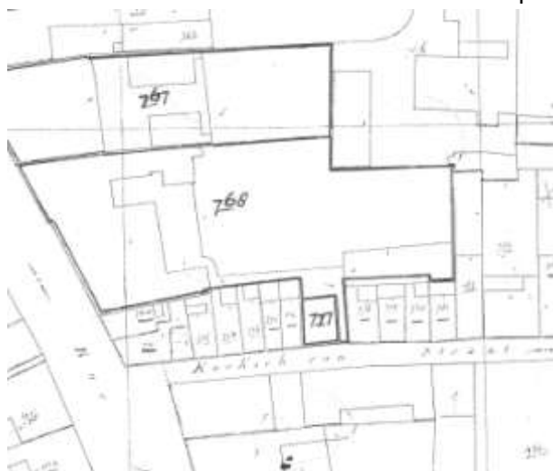
Oorspronkelijke toestand Kleine Gracht – Koekschroefstraat