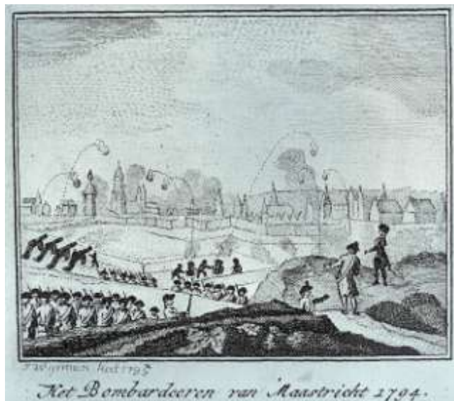
Het bombardement van Maastricht door de Fransen in 1794 waarbij ook het huis Kleine Gracht 22 zwaar getroffen werd.