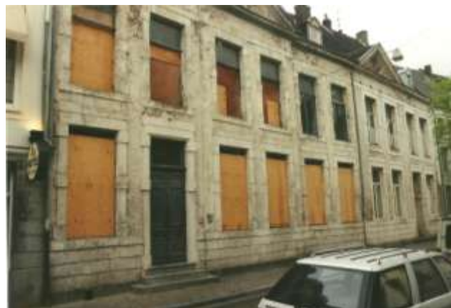
Voorkant van het pand in 2000 nadat de krakers het pand verlaten hadden. In het pand waren veel vernielingen aangericht.

Zoals gemeld was het huidige pand “Hotel Mabi” eigendom van baron G.J.J. de Crassier die gehuwd was met Agnes Loyens. Hij had het huis van notaris Thielens bij een openbare verkoop in 1759 gekocht. 10 Tijdens de volkstelling van 1802 - 1803 staan er geen bewoners vermeld. Wel wordt als eigenaar van het pand ... les héritiers de la Vve. Crassier ,