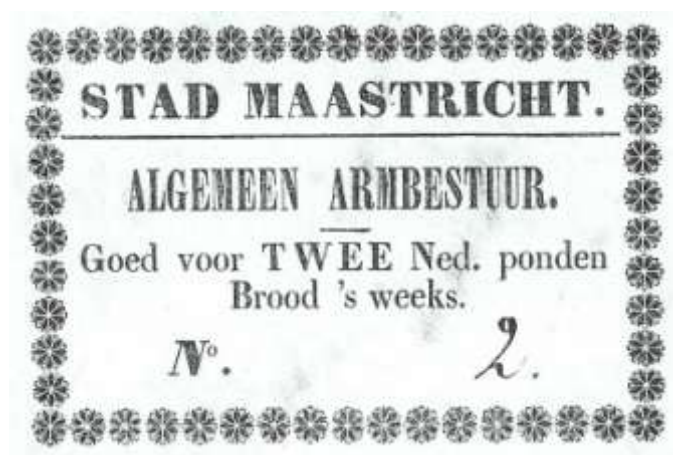
Broodbon door het Burgerlijk Armbestuur uitgegeven ca. 1850.

In 1851 kreeg Nederland een nieuwe Gemeentewet. Het gemeentebestuur was onder meer verantwoordelijk voor de handhaving van de openbare orde en de veiligheid, de gezondheid van mens en dier, het onderhoud van straten en waterlopen, de drinkwatervoorziening, het voorzien in goede woonomstandigheden, het aanbieden van lager onderwijs, het bevorderen van werkgelegenheid en de armoedebestrijding. Leest men de historie van Maastricht, dan lijkt het wel alsof al die bestuurstaken niet voor het gemeentebestuur van de stad golden.