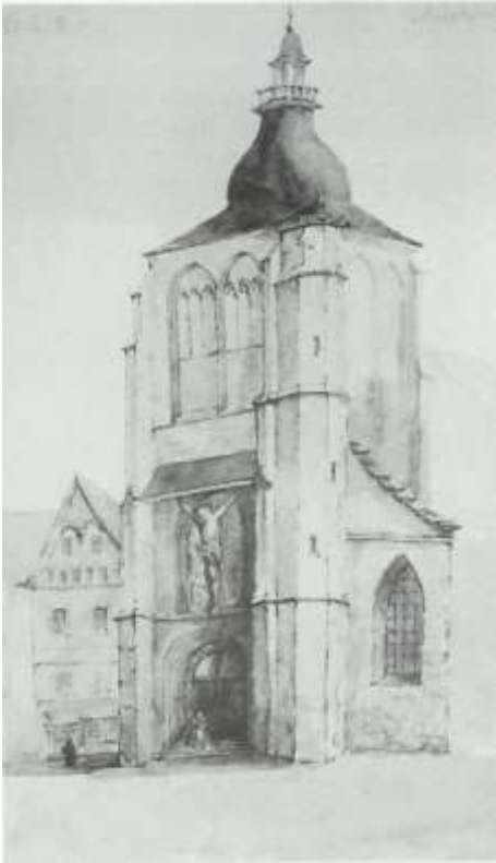
Sint Matthiaskerk ca. 1850. Let op de treden bij de ingang. Als de Maas buiten zijn oevers trad stroomde het water toch nog soms de kerk in.

een heuse “Verordening op de reinheid der straten en goten”, maar velen hielden zich daar niet aan. Elke woensdag en zaterdag liep “nen deender” met een bel schreeuwend door de straten: Straotkeere! Bewoners die hun stoep niet goed veegden, riskeerden een boete.