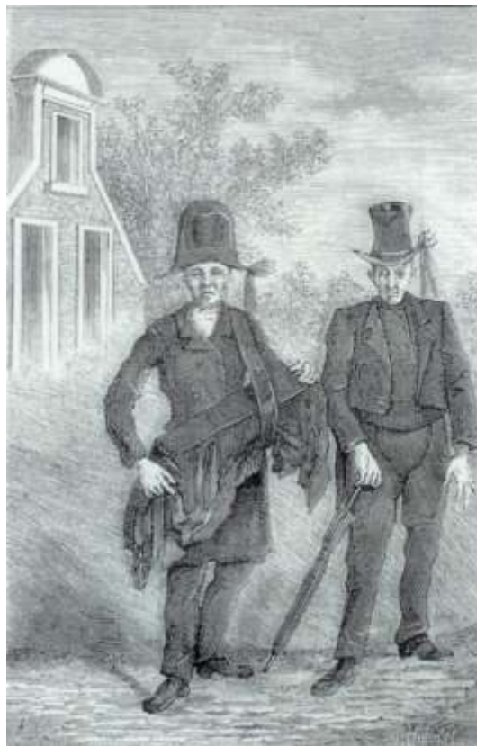
Kinderbegrafenis. In 1849 werd van gemeentewege besloten: “De gekiste lijken van kinderen beneden den ouderdom van 7 jaren mogen evenwel gedragen voor het lijf of onder den arm door een manspersoon, gekleed met rouwmantel en nedergeslagen hoed”.

woonadressen van de stamvader tegenkomen. Hier uit blijkt nog eens de verschillen in bewoners in deze straten.