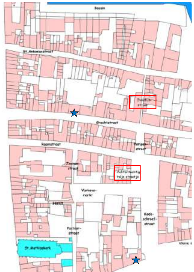
Plattegrond van het Boschstraatkwartier in 1880 na de aanleg van het Bassin en het Willemskanaal. De steegjes met de typische namen zijn omkaderd. Geheel beneden op de boek het pand Kleine Gracht 22.

De directeur van de papierfabriek Lhoëst zei dat de arbeider een beter onderdak in zijn fabriek had dan thuis. De woon- en hygiënische omstandigheden waren allerbelabberdst, er waren onvoldoende privaten en behoeftes werden op straat gedaan. Vooral straten met blinde muren genoten daarbij de voorkeur. Het verdwenen “Christusstraatje” had als bijnaam Sjiete-strüötsje . 3 Om een einde te maken aan de onhygiënische toestanden werd de “inrigting van secreten en secreetputten” verplicht. In elke woning of elke achtertuin moest een “huiske” aangelegd worden. Pas in 1881 voerde de gemeente een tonnenstelsel in voor de afvoer van fecaliën. Er was