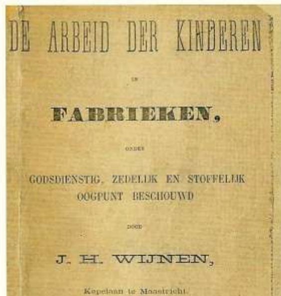
Aanklacht tegen de slechte werk- en woonomstandigheden in Maastricht in 1873 door kapelaan Wijnen van de Matthiasparochie, uitgegeven.

Het kon niet uitblijven dat de wijze van ondernemen door de zonen van de oude Regout reacties van het personeel zou oproepen. In het voorjaar van 1886 was het zo ver. De glasblazers zijn vast beraden en gaan staken. Een loonsverlaging die