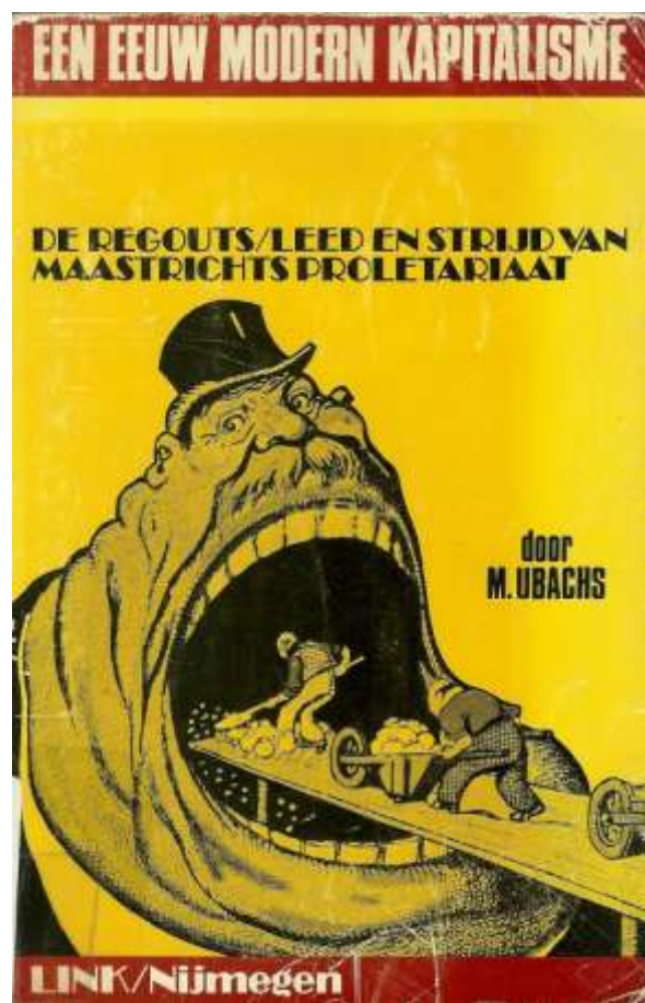
Voorzant van de herdruk van het boek van M. Ubachs, 1934.

— Van de 54 glasblazers, die in de fabriek der firma P. Regout het werk hebben gestaakt, heeft een twintigtal zich weder aangemeld. Aan hen kan eerst na eenigen tijd weder werk worden gegeven, daar een der glasovens, ten gevolge der werkstaking, onbruikbaar is geworden. De overige werkstakers hebben meerendeels elders werk gezocht.