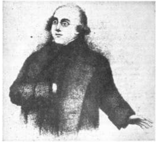
Jan Pieter Minckeleers, naar een litho van de Maastrichtse kunstenaar Jan Nicolaas Brabant (1806-1886).

Voor ons mensen van nu is het opmerkelijk dat het hele fabrieksreglement van 20 artikelen voor de kristal- en glasslijperij in het Frans is opgesteld. Een