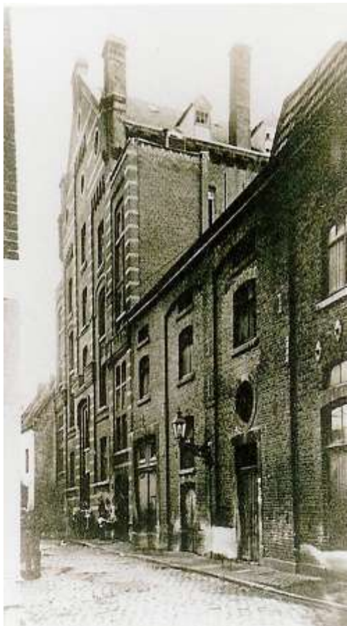
De Groete Bouw toen de vervallozing het ergst was.