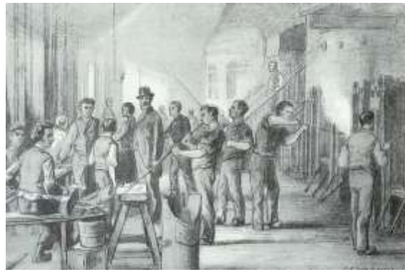
Glasblazerij ca. 1887. Zo kunnen we ons ook voorstellen hoe stamvader Dielemans met zijn 10-jarig zoontje heeft gewerkt. Tekening van P. Schipperich