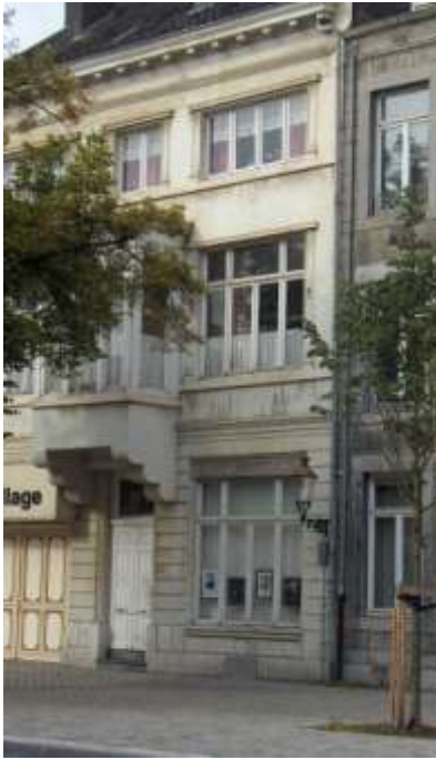
Links: Boschstraat 30 in 2012.