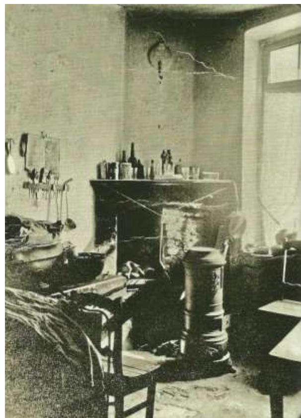
Arbeiderswoning in de Cité Ouvrière, Grachtstraat. Er waren 72 eenkamervoningen van zo'n 60 vierkante meter elk.