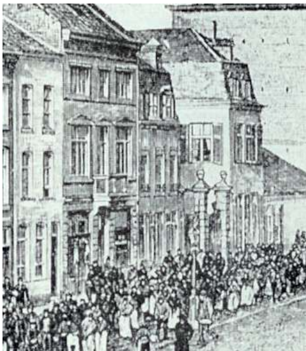
Het moet een heerlijk gevoel geweest zijn om te weten dat er elke dag een stroom van dorstig volk aan de deur van je café voorbij gaat.