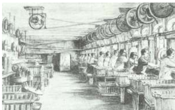
Overzicht van een afdeling glasslijperij, ca. 1890.