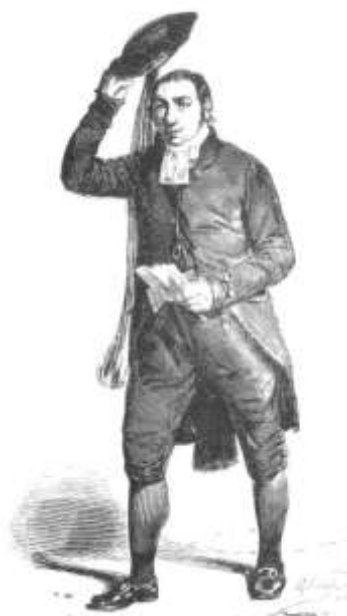
Aanspreker, ook wel doodsbidder genoemd. Ging in vroeger tijden familie en buurtbewoners bekend maken met het overlijden van iemand. Aan zijn hoed was een lange sleep bevestigd.