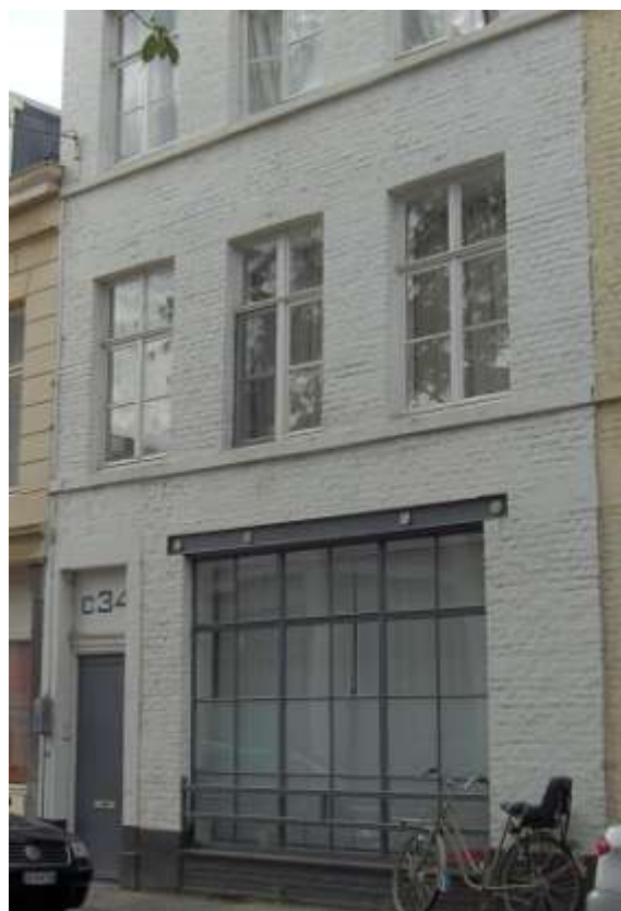
Capucijnenstraat 34 (vroeger 1555)