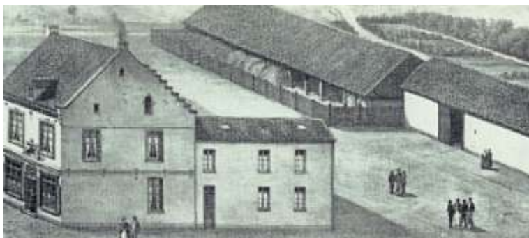
(Pijl) Maastrichter Grachtstraat 2, geboortehuis Ampa. Verderop in de Grachtstraat de "lâiterie", boerderij voor de melkvoorziening van de arbeiders. Op de boek Boschstraat Regout's bakkerij . [Afbeelding uit 125 Sphinx Céramique 100].