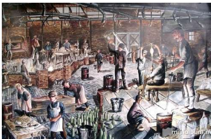
Kinderarbeid in de glasfabriek van Regout.